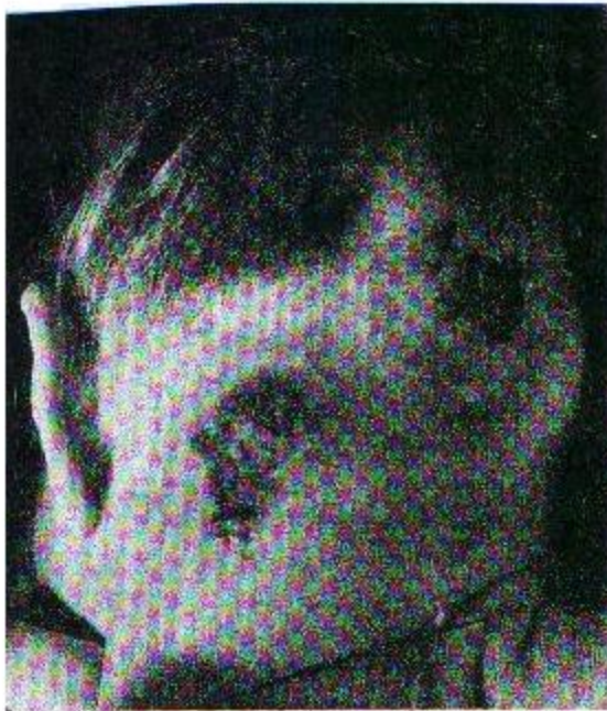
Рис. 1. Карбункулы задней поверхности шеи и затылочной области.

казания к наложению первичных швов и ранней аутодермопластике, в 1,6 раза сокращает продолжительность лечения.