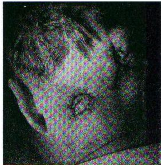
Рис. 2. Фото после аутодермопластики